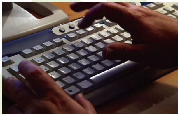
Borna, Sachsen: Angebot einstellen

Traders' Dreams verwebt auf überraschende und unterhaltsame Weise persönliche Ebay-Geschichten mit einem globalen Wirtschaftskrimi. Es geht um die Philosophie, die hinter dem „System eBay“ steckt, um die Verheißungen, mit denen eBay und andere aus lokalen Flohmärkten globales Business machen. Wie steht es um die Verwirklichung des sagenhaften Traums von einem System, in dem alle gewinnen können?