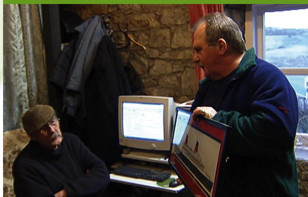
Spike und Archie, Isle of Skye