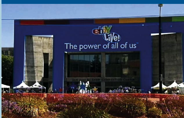
San José, Kalifornien