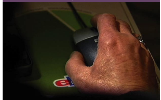
Spike, Powerseller auf der Isle of Skye