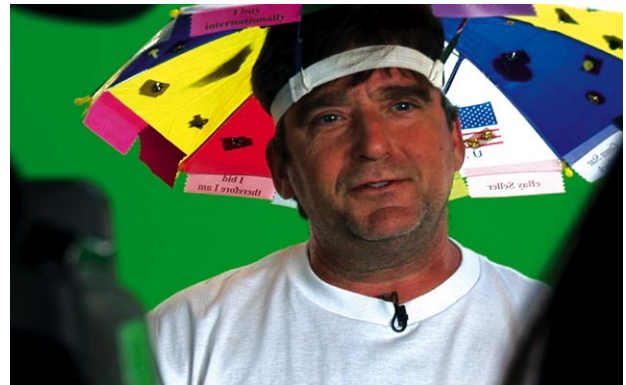
Gratulant auf der eBay-Live zum 10jährigen Firmenjubiläum

© 2007 Filmquadrat, 83 min, Farbe, 1:1,85, Dolby Digital