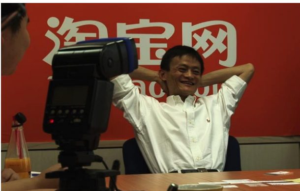
Jack Ma, Alibaba / Taobao