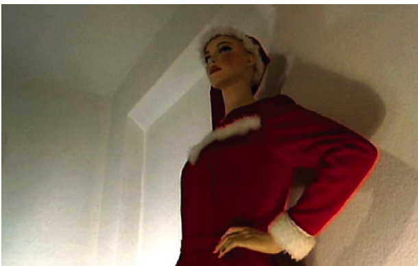
Weihnachtsfrau-Kostüm, von Meisterhand gefertigt, Applikationen und Bommel

ST Bei eBay muss man unterscheiden zwischen den Mitarbeitern der ersten Stunde und den neuen „Machthabern“ im Konzern. Selbst der Gründer Pierre Omidyar wird inzwischen von der PR-Abteilung in den USA abgeschirmt. Wenn er auftritt, dann meist mit abgesprochenen Fragen durch eBay-Moderatoren. Vor diesem Hintergrund muss man sagen, dass uns eBay Deutschland sehr unterstützt hat. Wir konnten ein Video-Casting bei einer Veranstaltung in Potsdam machen, durften die eBay-University in Dresden drehen und wurden schließlich auch zur eBay-Live in Kalifornien zugelassen.