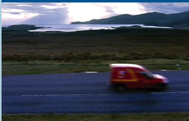
Isle of Skye, Schottland