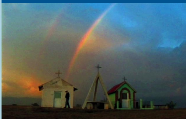
Mata Ortiz, Mexiko